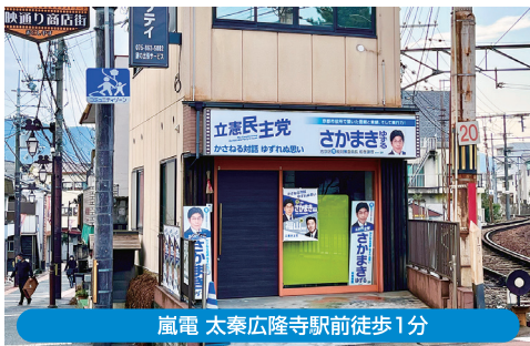
嵐電 太秦広隆寺駅前徒歩1分